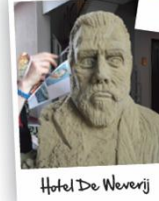
Hotel De Weverij