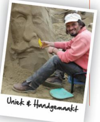
Uniek & Handgemaakt

De volgende formaten zandsculptuur zijn mogelijk: