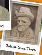
Galerie Sous Terre