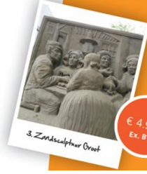
3. Zandsculptuur Groot