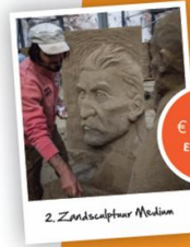
2. Zandsculptuur Medium