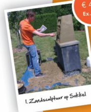
1. Zandsculptuur op Sokkel